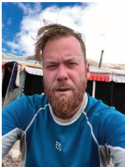
Dobojováno. Jsem odeslán do baráže.

a budu schopen se soustředit na výstup, reálně určitě není.