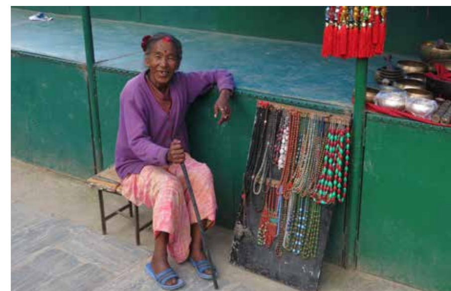
V Nepálu se pracuje až do stáří...