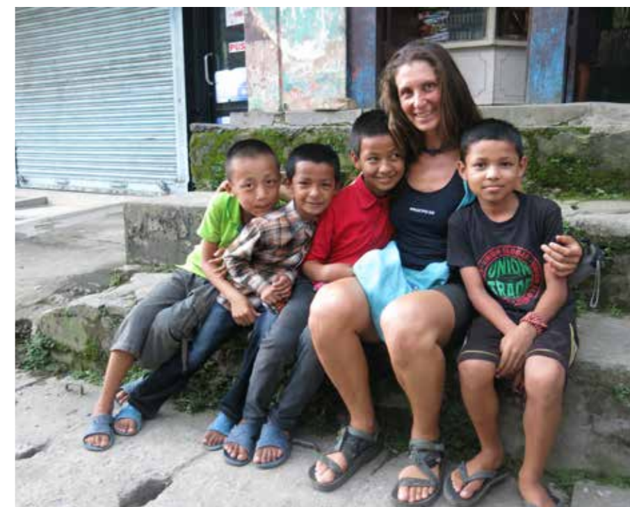
Noví kamarádi v Berishavaru