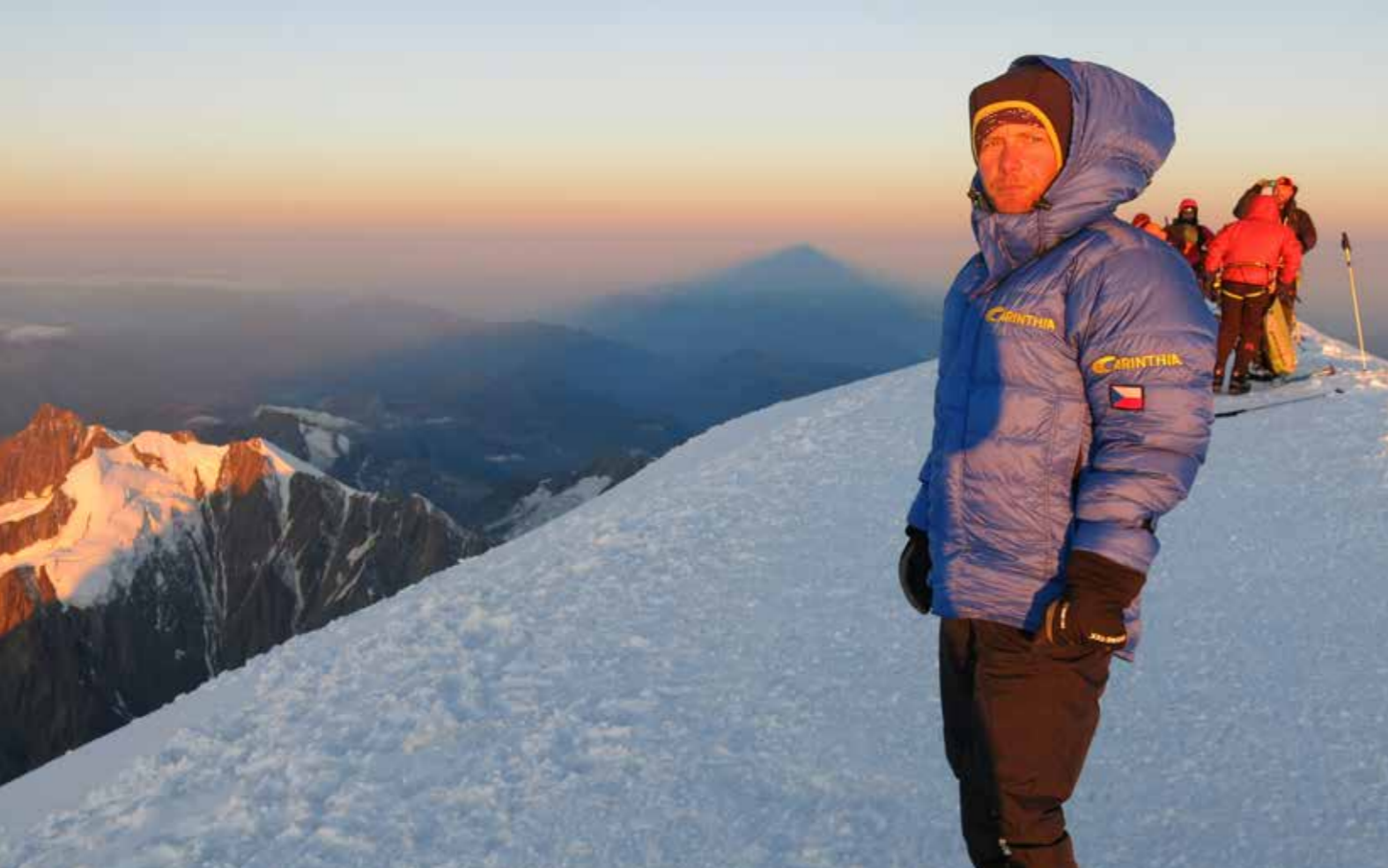
Soustředění na Mt. Blancu